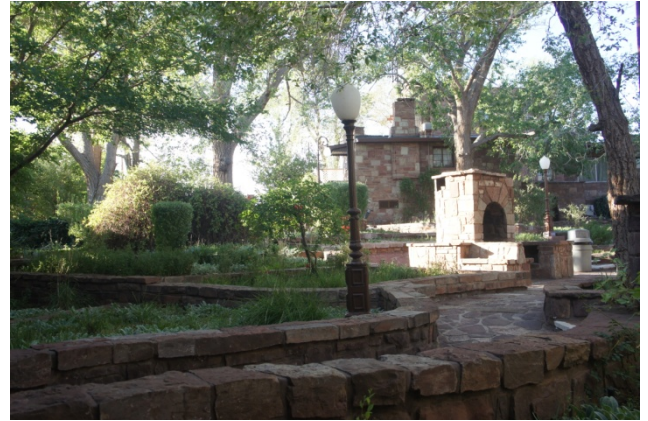
vue intérieure du parc de l'hôtel

En allant sur Cameron, nous avons fait quelques arrêts à Sunset Crater et à des ruines Pueblo.